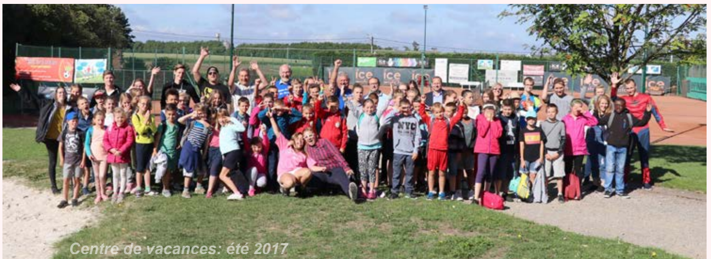
Centre de vacances: été 2017