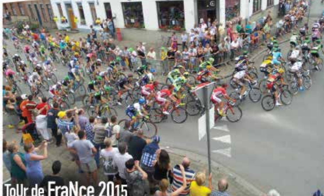
TouR de FraNce 2015