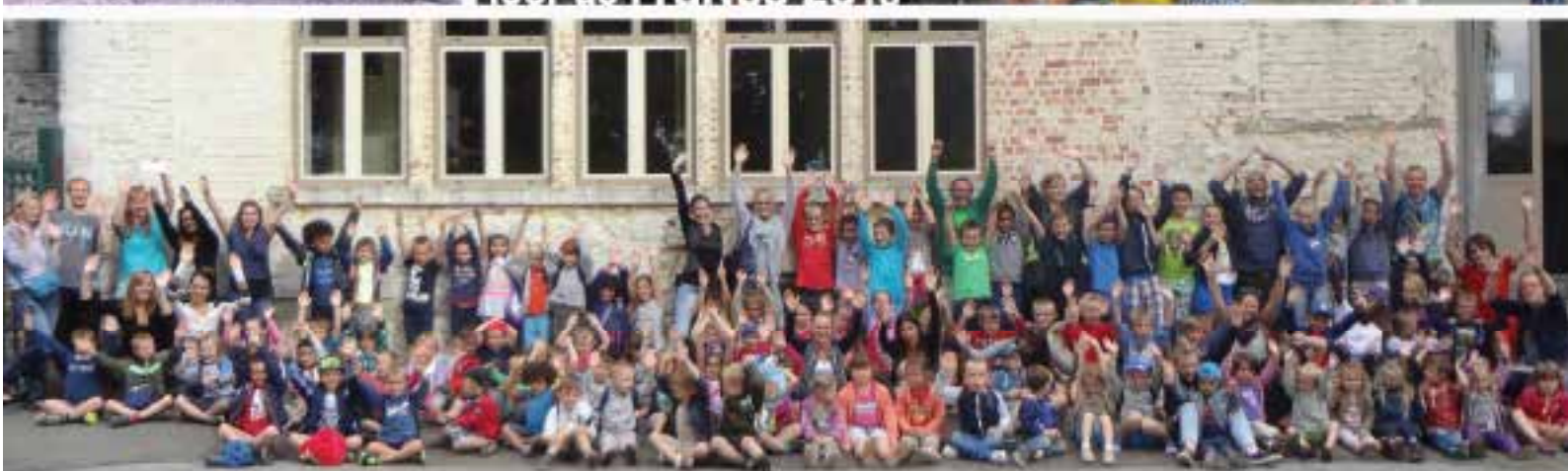
ceNtre de vaCances

CPAS: 071/058130 - Police: 071/058240 ou 107