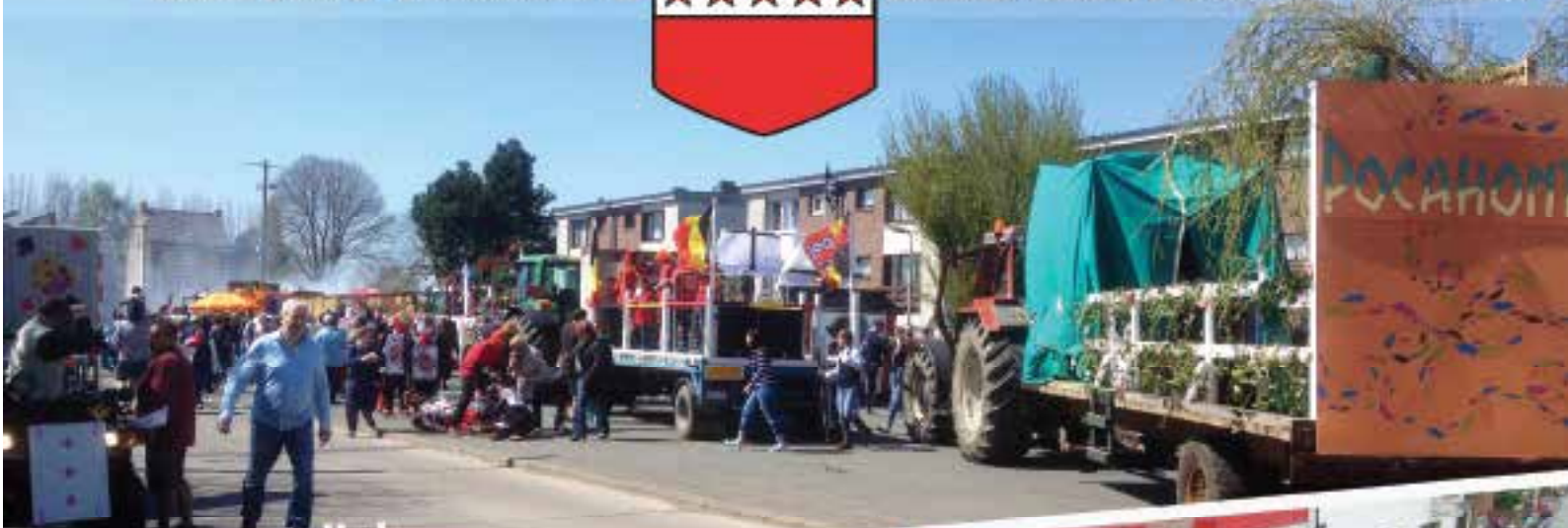
GrAnd feu de Mellet

Administration communale de Les Bons Villers - Place de Frasnes, 1