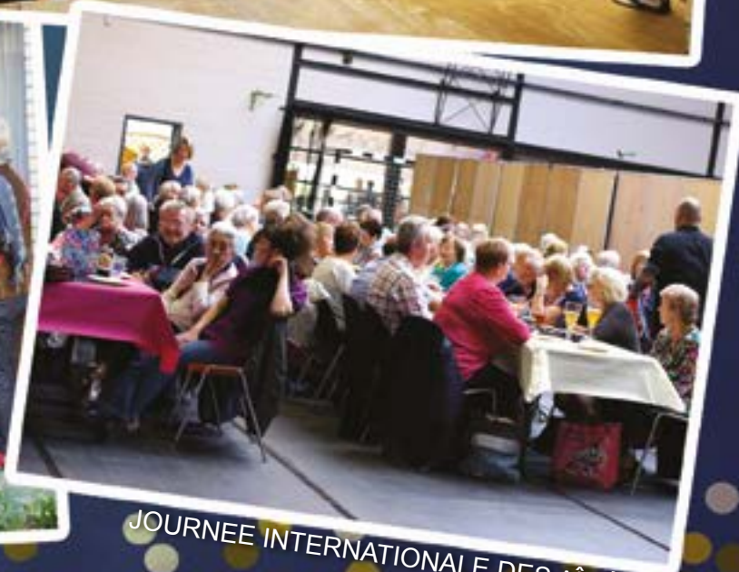
JOURNEE INTERNATIONALE DES AÎNÉS