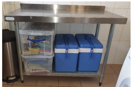
1 Table en inox : 120X60X90