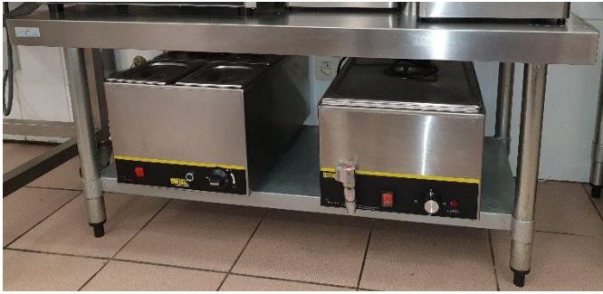
1 Table en inox : 120X60X58