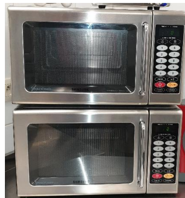
1 Four à micro-ondes