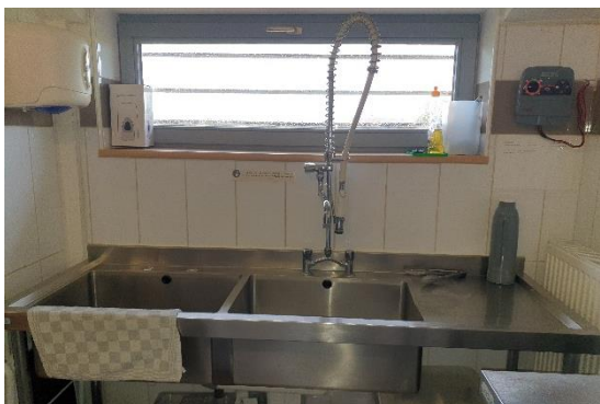
1 Double évier