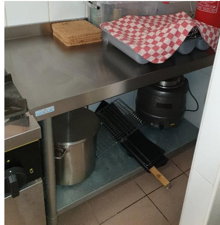
1 Table en inox : 120X60X80