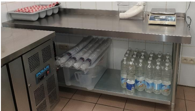
1 Table en inox : 180X60X84